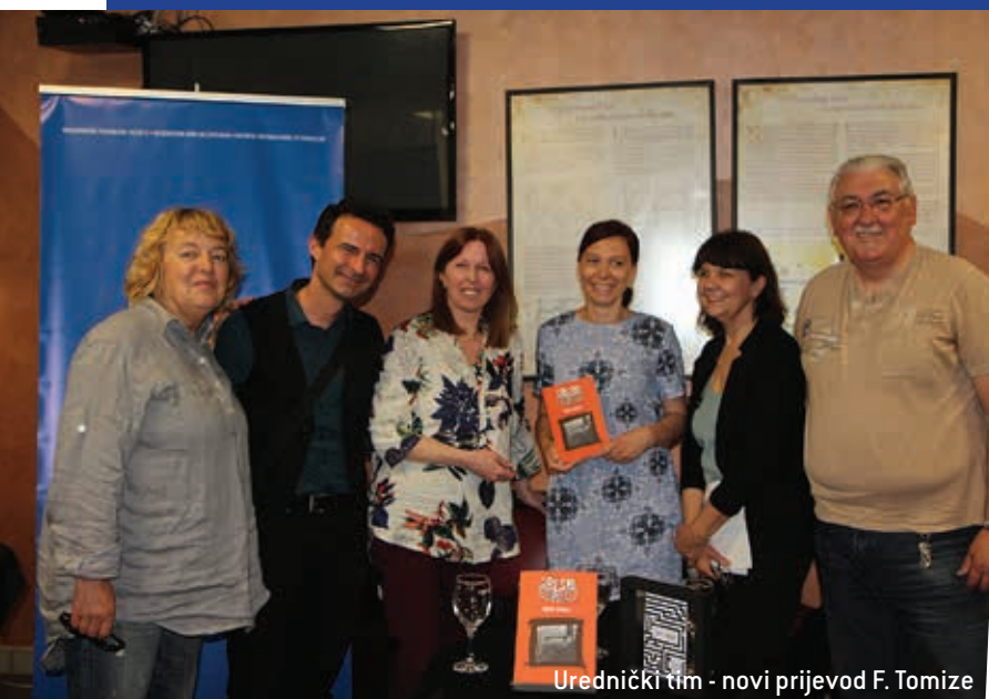
Urednički tim - novi prijevod F. Tomize