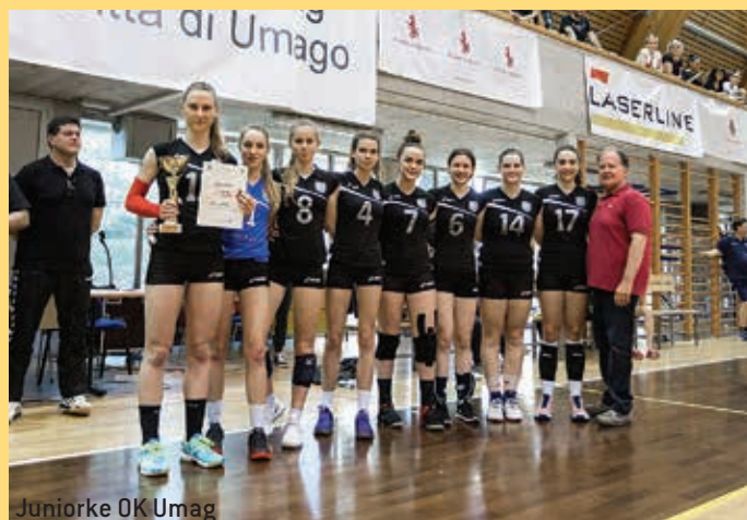
Juniorke OK Umag

Un torneo ben organizzato e davvero importante, a dimostrazione che la pallavolo a Umago è davvero di casa.